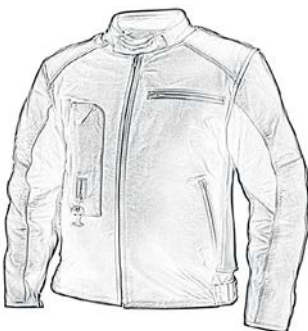
Cuir Roadster oder Xena