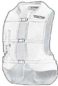
Airnest oder Turtle